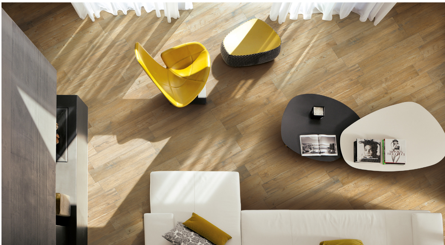
FRESH (Or Pâle)