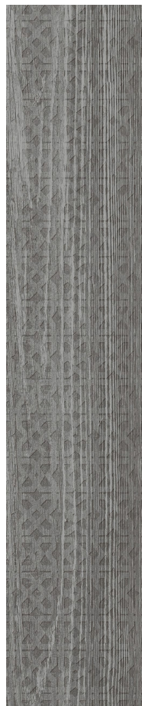
15 x 75 cm (6 x 30) RF.LX.SHA.0630.DECO

Tous les items présentés dans ce document font partie du programme d'inventaire Olympia . Pour les commandes spéciales, veuillez contacter votre représentant de Tuiles Olympia.