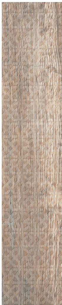
15 x 75 cm (6 x 30) RF.LX.NAT.0630.DECO