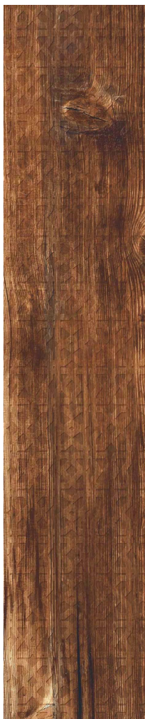
15 x 75 cm (6 x 30) RF.LX.SUN.0630.DECO